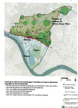
Valoriser le cadre de vie et développer le territoire à travers la dimension environnementale et paysagère - améliorer la qualité des centres de ville et de Bourg le long du R20, - affirmer les limites des services urbains et sanctuariser la division parcellaire, - concilier la qualité paysagère des villages de l'Entre-Deux-Mers, - renforcer la visibilité de certains quartiers.

Axe 3 : Valoriser le cadre de vie et développer le territoire à travers la dimension environnementale et paysagère